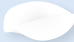
中心循環系心血管用パッチ